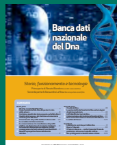
BANCA DATI NAZIONALE DEL DNA Novembre 2016