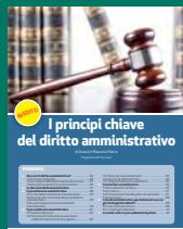
I PRINCIPI CHIAVE DEL DIRITTO AMMINISTRATIVO Gennaio 2017