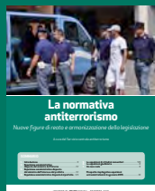
LA NORMATIVA ANTITERRORISMO Ottobre 2016