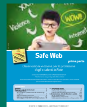
SAFE WEB PRIMA PARTE Agosto/settembre 2017