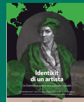
IDENTIKIT DI UN ARTISTA Febbraio 2017