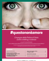
#QUESTIONONÈAMORE Dicembre 2016