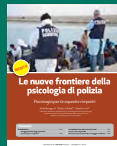
LE NUOVE FRONTIERE DELLA PSICOLOGIA DI POLIZIA Gennaio 2017