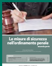
LE MISURE DI SICUREZZA NELL'ORDINAMENTO PENALE SECONDA PARTE Giugno 2017