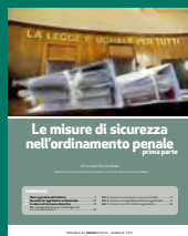
LE MISURE DI SICUREZZA NELL'ORDINAMENTO PENALE PRIMA PARTE Maggio 2017