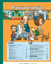
PROTEZIONE FAMILIARE Luglio 2017