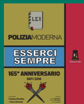
COMPENDIO DATI Aprile 2017