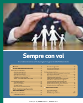
SEMPRE CON VOI Marzo 2017